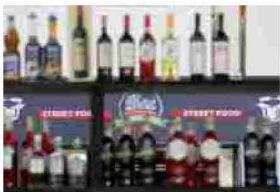
Baritalia Hub sbarca a Bari il 25-26 settembre 2017