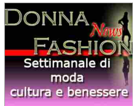
Nasce il primo settimanale di moda, cultura e benessere: DONNA