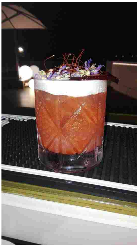
il Lady Morgana di Valeria Pieri

sessanta iscritte. Si contenderà la vittoria il 24 e il 25 settembre al Palacongressi della città romagnola.