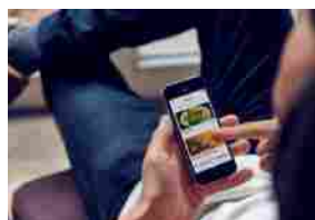
Deliveroo, consegna gratuita illimitate con l'abbonamento Deliveroo Plu...