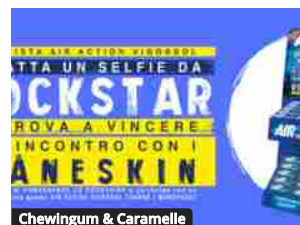
Chewingum & Caramelle Con Air Action Vigorsol un nuovo

VENITE A TROVARCI NEL MUSEO DEL COMUNISMO