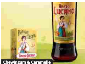
Chewingum & Caramelle Sono arrivate le Pastiglie Leone