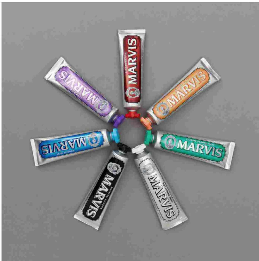
Fattobene, Marvis, Composizione

Quello che gli oggetti raccontano di noi. Vita quotidiana, relazioni, professioni, stili, gusti, desideri, passatempi, vizi, vezzi e romantiche. Quello che siamo, quello che facciamo, quello che ci incarna e ci seduce, nell'immensa costellazione di cose comuni diventate brand, spot, parole costanti, icone tascabili. L'Italia si descrive anche così, mettendo in fila prodotti commerciali, che nel giro di due o tre secoli hanno definito identità, carattere e abitudini di una comunità. Essendo spesso riconoscibili nel mondo. E proprio oltreconfine questo bastimento pop – da passare in rassegna con una dose d'affettuosa nostalgia – continua a farsi conoscere, a raccontare.