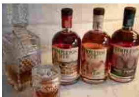
Branca annuncia l'accordo di distribuzione di Templeton Rye in It...