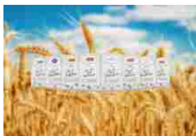
Gruppo Casillo, nasce il nuovo progetto di Filiera Prime Terre