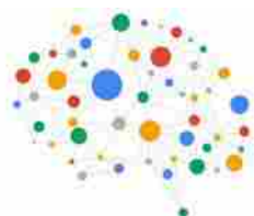
Intelligenza artificiale, da Google lo strumento per valutarne i vantag...