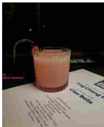
"Ciao bella", il cocktail vincente