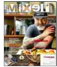
319 Settembre 2019