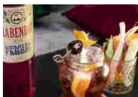
Fabbri 1905 presenta molte novità ad Host