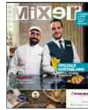
320 Ottobre 2019