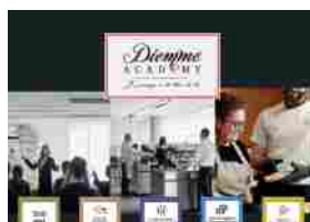
Diemme Academy: i corsi su caffè, food e management danno valore al bus...