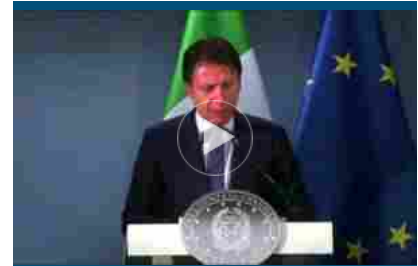
Alitalia, Conte: auspicio operazione di mercato, sostenibile