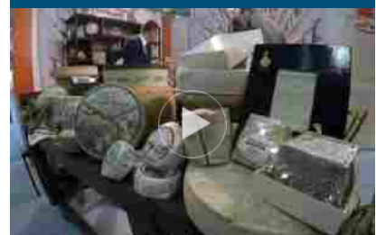
A Bergamo c'è “Forme”, manifestazione dedicata ai formaggi