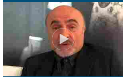
Ivano Marescotti: i migranti vanno aiutati, questione di umanità