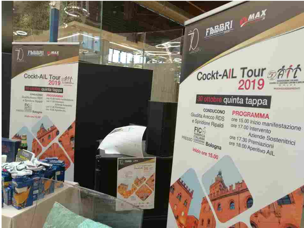
La quinta tappa bolognese di Cockt-AIL si è svolta a Fico