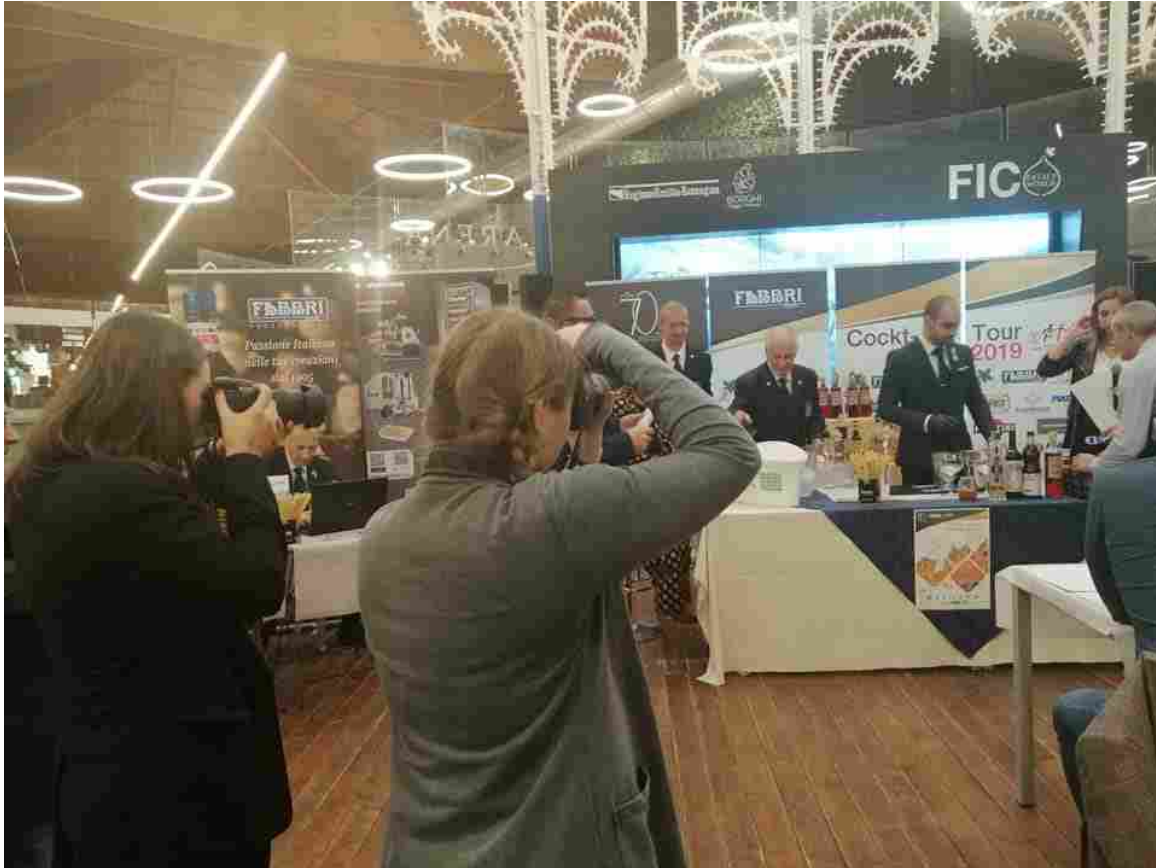
Un momento della gara con i fotografi pronti allo scatto