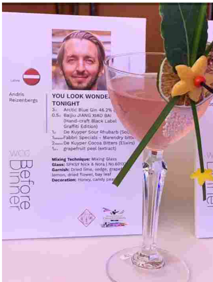
You Look Wonderful Tonight

Il bartender consiglia di servire in un SPKSY Nick & Nora I No.601329. Guarnire poi con dried lime, sedge, grapefruit, lemon, dried flower, bay leaf. Decorare con honey e candy pearls.