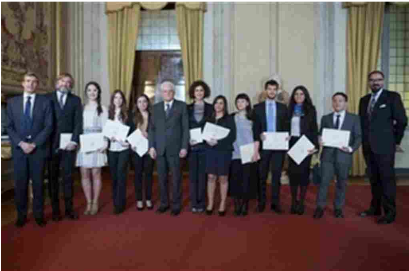
Una passata edizione dei Premi di laurea - Comitato Leonardo

Gli studenti neolaureati potranno inviare le candidature fino al 10 giugno 2021