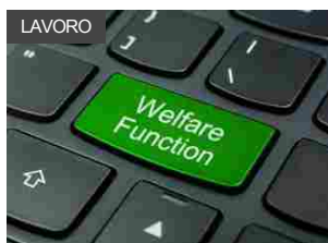
L’Oréal, nuovo contratto integrativo aziendale e accelerazione su welfare