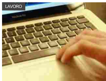
Fondirigenti, avviso formazione a sostegno imprese del made in Italy