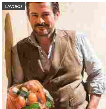
Agricoltura: clementine, cambiamento climatico riduce