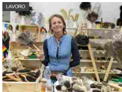
‘Artigiano in fiera: finalmente!’, 1° evento phygital di arti e mestieri dal mondo