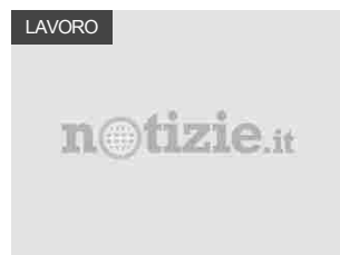
Fisco: Consulenti lavoro, ecco sintesi operativa su istituto del ravvedimento