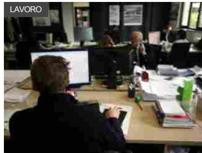
Al via servizio Camere di commercio per collegare imprese alla Pdnd

Dunque, con le nove associazioni presenti abbiamo avuto una rappresentazione completa della filiera del gelato con un apprezzamento pieno per il palinsesto di temi e le opportunità di sviluppo che animeranno Sigep 2022”. Un Sigep22 in tutta sicurezza per buyers e aziende grazie al protocollo anti-covid #safebusiness by leg e all’accreditamento mondiale Gbac Star.